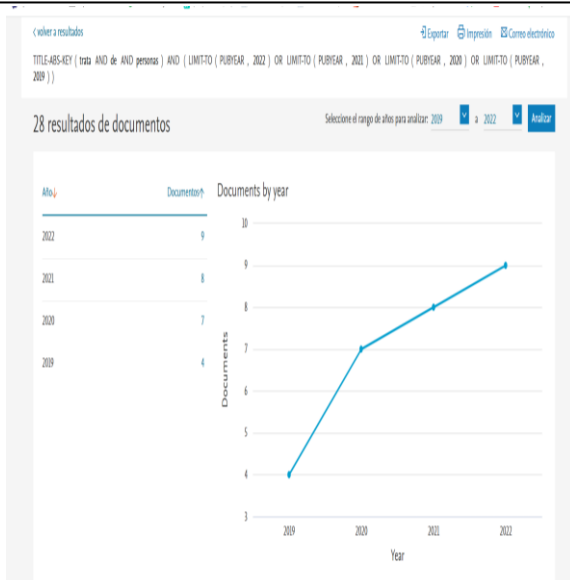
Figura 2. Metaanálisis desde el estado del arte - SCOPUS

En el contexto internacional la trata y la vulneración a derechos fundamentales se han acrecentado frente a factores exógenos que lindan con la prostitución, corrupción y diferencias sociales con discriminación, de ahí que, frente a la carencia de aplicación del paradigma de la protección integral además de la falta de efectividad, situación de que se acrecienta como consecuencia de un deficiente manejo de los organismos del Estado y preferentemente jurisdiccionales en los procedimientos judiciales evidencia notoria falta de oportunidad, diligencia debida, entre otros, las cuales generan un aislamiento depresivo de la víctima (Quiri y Pérez 2018).