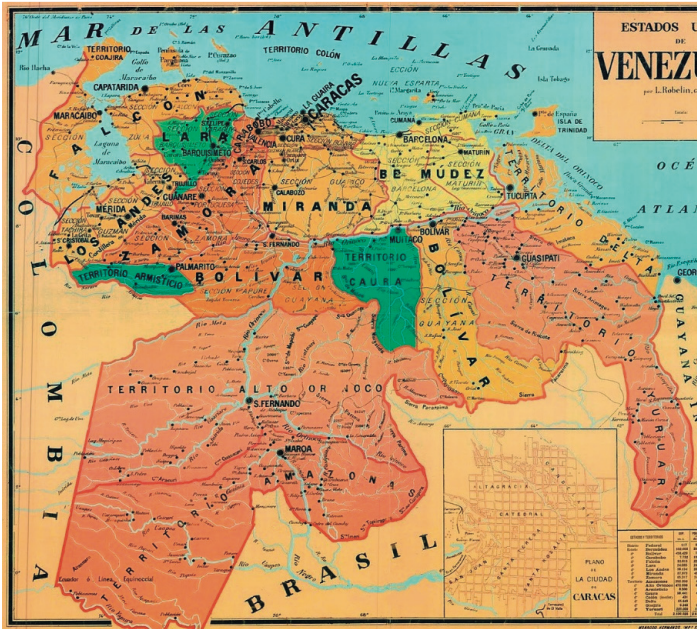
Mapa de los Estados Unidos de Venezuela, por L. Robelín, representando los Territorios Federales creados hasta 1884

Esa era la situación constitucional o de derecho interno de Venezuela a finales del siglo XIX sobre su territorio en la zona de Guayana, cuando en 1895 se inició un conflicto internacional entre Venezuela y el Reino Unido por reclamaciones sobre ocupaciones británicas ilegítimas de la zona venezolana al oeste del río Esequibo, que llevó incluso a la ruptura de relaciones diplomáticas. Todo ello originó la intervención de los Estados Unidos de Norteamérica invocando la Doctrina Monroe en protección de los intereses venezolanos, concluyéndose el conflicto internacional con la celebración en Washington, el 2 de febrero de 1897, de un Tratado de Arbitraje entre los Estados Unidos de Venezuela y Su Majestad la Reina del Reino Unido de la Gran Bretaña e Irlanda, para que un Tribunal arbitral determinara “la línea divisoria entre los Estados Unidos de Venezuela y la Colonia de la Guayana Británica.”