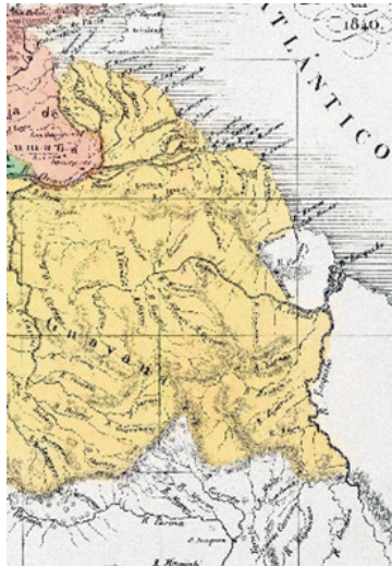
Detalle del límite Este de la Provincia de Guayana en el río Essequibo

Específicamente, el límite oriental de la Provincia de Guayana en el mismo Atlas de Codazzi, quedó representado en dos Cartas detalladas de los Cantones de Picaroa y de Upata, en la siguiente forma: