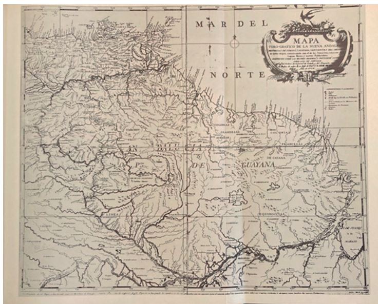
Mapa corográfico de la Nueva Andalucía, Provincias de Cumaná y Guayana, vertientes del Orinoco Su origen cierto, comunicación con el Amazonas, situación de la Laguna de Parine y nuevas poblaciones, por Luis de Surville, 1778

reconocido la independencia de los Países Bajos y la existencia de una colonia holandesa de naturaleza comercial al este del río Esequibo.