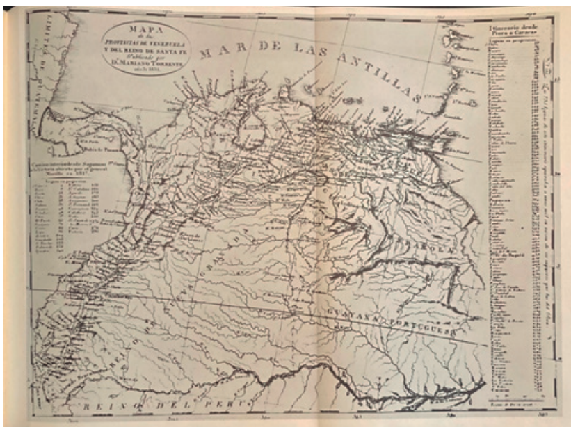
Mapa de las Provincias de Venezuela y del Reino de Santa Fe, por Mariano Torrente 1831