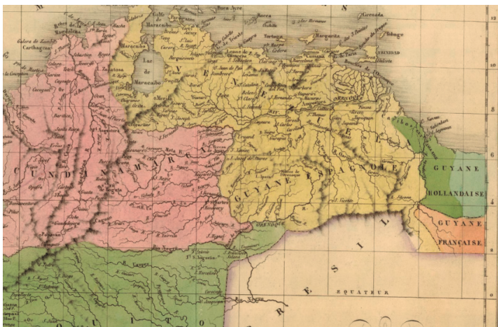
Detalle de la Carta de J.A.C Buchon, Carte Géographique, Statistique et Historique de la Republicque Comombienne, J. Carez, Paris, 1825

Esa situación se reflejó también, por ejemplo, en el Carte Géographique, Statistique et Historique de la Republicque Colombienne (J. Carez, Paris, 1825), que fijaba, conforme al Decreto del Libertador, el límite entre la Provincia de Guayana y las posesiones de los Países Bajos se ubica a lo largo del curso del río Esequibo, excepto en el norte en la zona de la costa entre el río Moruco y la desembocadura del río Esequibo, que se atribuye a la Guyane Hollandaise :