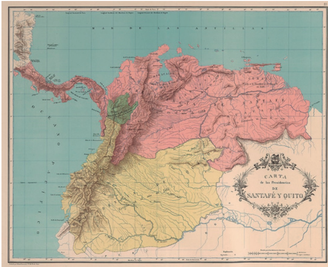
Carta de las Presidencias de Santa Fe y Quito 1564

España y de la Audiencia de Santa Fe, 15 llegando por el extremo oriente hasta Trinidad, Isla que le quedó integrada (Provincia de Trinidad y la Guayana) hasta 1731, pasando a formar parte entre 1733 y 1762 de la Provincia de Nueva Andalucía. El territorio de la provincia llegaba hasta el Amazonas, pues desde la decisión del Consejo de Indias de 12 de octubre de 1595, la Corona había entregado a Berrío todas las capitulaciones amazónicas realizadas hasta esa fecha, es decir “todas las Provincias inclusas y comprendidas entre los Ríos Orinoco y Marañón.” 16