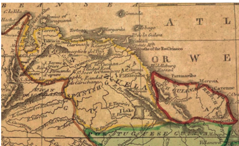
Mapa de Venezuela, la Guayana Británica (Guayana Inglesa), la Guayana Holandesa (Hoy Surinam) y la Guayana Francesa, publicado en Boston, 1821 (Cummings & Hilliard). Muestra el Río Esequibo como el Limite oriental de Venezuela