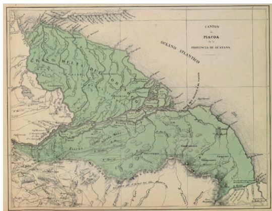
Carta del Cantón de Piacoa de la Provincia de Guayana. Tomado del Atlas físico y político de la República de Venezuela, Agustín Codazzi, 1840

Esa situación se reflejó también, por ejemplo, en el Carte Géographique, Statistique et Historique de la Republicque Colombienne (J. Carez, Paris, 1825), que fijaba, conforme al Decreto del Libertador, el límite entre la Provincia de Guayana y las posesiones de los Países Bajos se ubica a lo largo del curso del río Esequibo, excepto en el norte en la zona de la costa entre el río Moruco y la desembocadura del río Esequibo, que se atribuye a la Guyane Hollandaise :