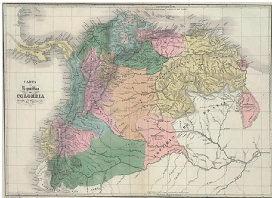
Carta de la República de Colombia dividida en 12 departamentos en 1824. Por Agustín Codazzi, Tomado del Atlas físico y político de la República de Venezuela, 1840