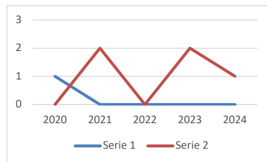
Figura 2. Distribución de artículos por año, según bases de datos

En la Tabla 2, se presentan los artículos que han sido incluidos en la muestra del estudio sobre la categoría Estrategias Didácticas, luego del proceso de selección, en total son 6, comprende la base de datos de la que se recuperó durante el proceso de la revisión sistemática, el año de su publicación, la