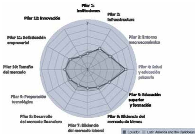
Figura 1. Pilares de competitividad, Ecuador versus promedio de América Latina y el Caribe

La figura 2, nos muestra la puntuación de cada uno de los pilares de Ecuador y la comparación con el promedio de América Latina y el Caribe, se afirma que principalmente los pilares de salud y educación primaria e infraestructura, son las puntuaciones que se han incrementado versus el promedio de la región, esto se debe a las construcciones e inversión pública por parte del estado. Sin embargo, hay áreas como la preparación tecnológica y el desarrollo del mercado financiero que necesitan una mayor atención ya que están debajo del promedio.