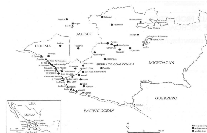
Figura 1. Mapa de la costa de Michoacán y Colima, mostrando los principales sitios productores de sal, visitados por el autor en 2000.

En la primavera del 2000 hicimos una investigación etnoarqueológica en las salinas de La Placita de Morelos, poblado enclavado en la costa de Michoacán (Figura 1). En Abril de 2016 regresamos al lugar para darnos cuenta de que las salinas fueron abandonadas desde hace varios años pues los antiguos salineros han emigrado o se dedican a otras actividades. Ha sucedido lo que ya se anticipaba en el estudio original (Williams 2003, 2015, 2016): ha desaparecido por completo la tradición salinera en el área bajo estudio, que tenía una antigüedad de por lo menos 500 años (Acuña, 1987). Lo que sigue a continuación es un “rescate etnográfico” de esta tradición salinera. Al final del texto presento una reflexión sobre las implicaciones culturales de la desaparición de esta industria tradicional.