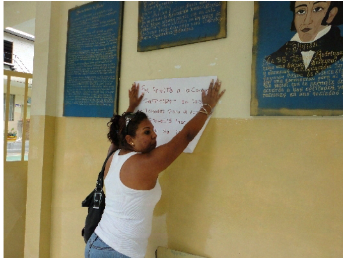
Colocación de avisos