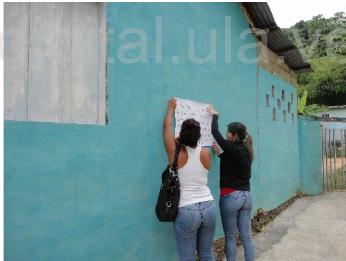
Colocación de avisos