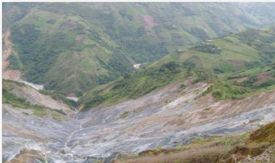
Cárcava de San José. Cuenca alta del Municipio Uribante. Principal depositaria de los sedimentos al embalse la Honda.