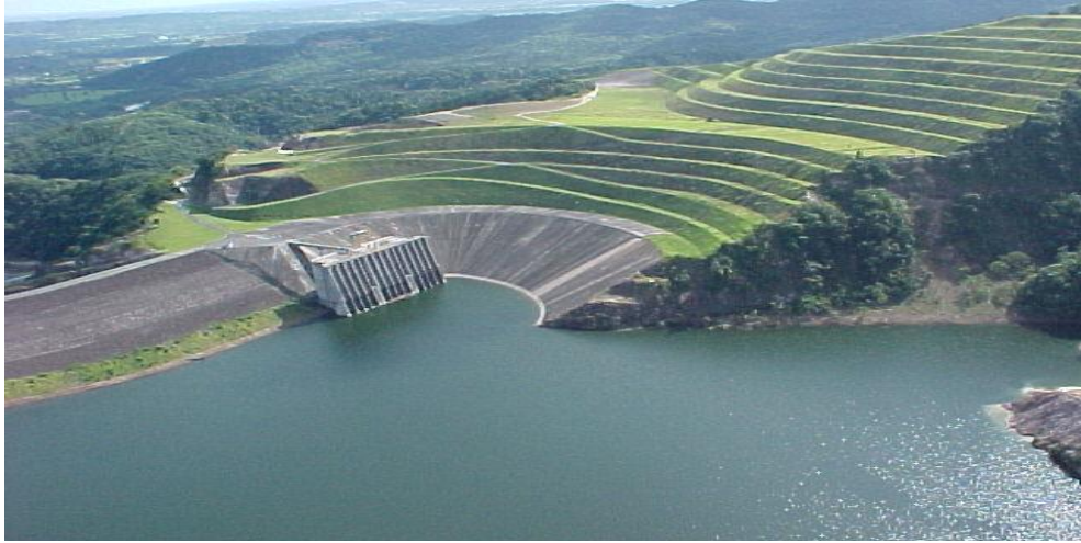
Vista panorámica del embalse y central La Vuelta, 2005.