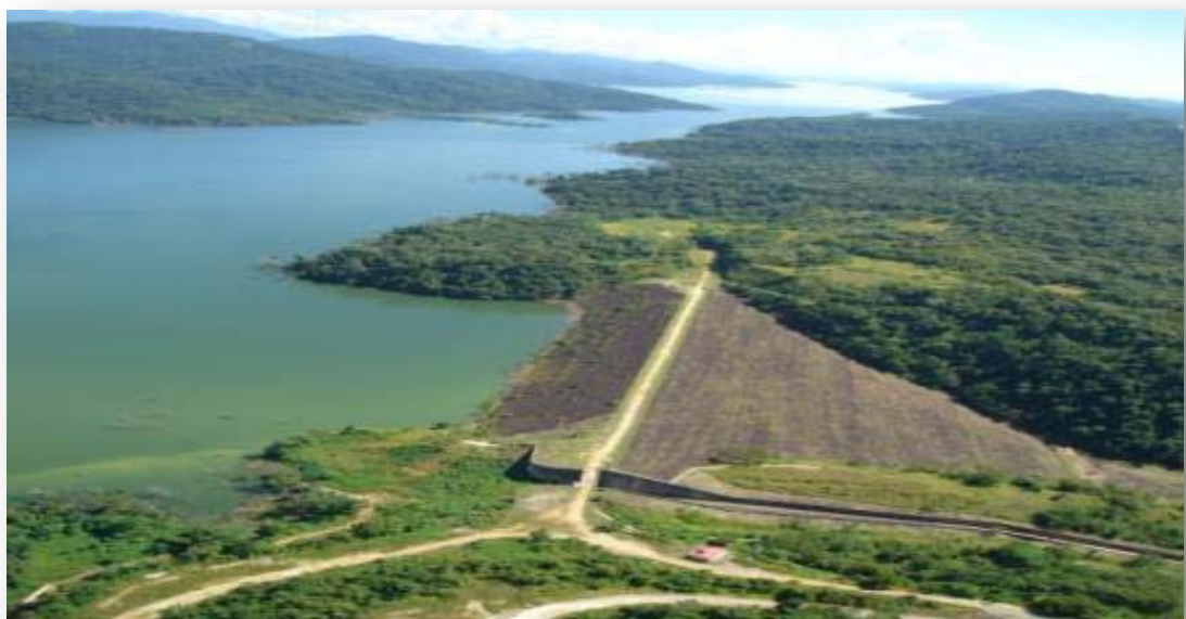
Vista panorámica del embalse y Presa la Honda, 2005.