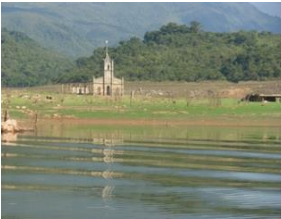
Población de Potosí, inundado completamente por el llenado del embalse la Honda. .