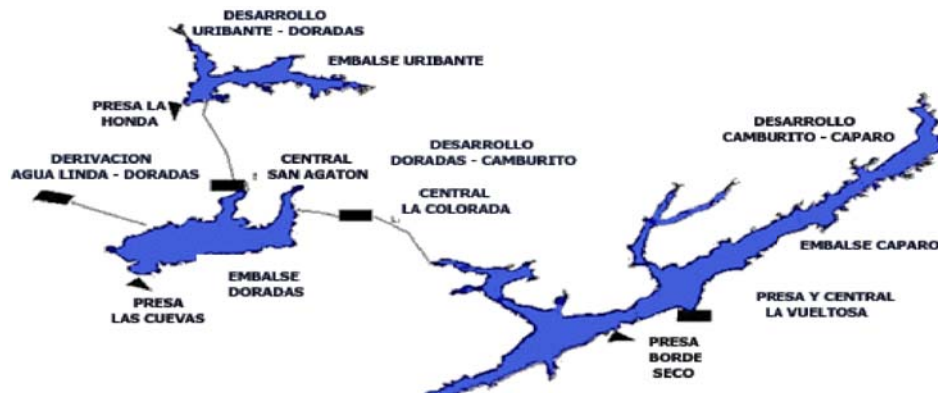
Imagen 1. Mapa del Proyecto ganador.

El desarrollo más alto, Urribante-Doradas, en la cota 1.098, posee el embalse Urribante, la presa la Honda y la central San Agatón. Además, posee una derivación denominada Agua linda-Doradas. Más adelante, a la derecha del mapa (ver Imagen 1), se representa el desarrollo Doradas-Camburito, ubicada su presa en la cota 706, denominada Presa Las Cuevas, su embalse es Doradas y su central es La Colorada. Finalmente, el tercer desarrollo Camburito-Caparo, ubicado en la cota 310, comprende dos presas denominadas Borde seco y La Vueltona, su central es La Vueltona y el embalse es Caparo.