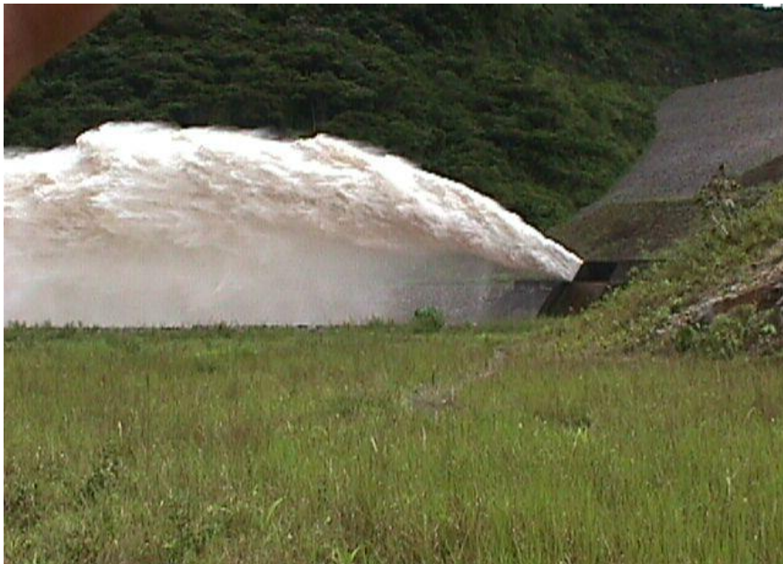
Embalse la Honda, aliviando sus aguas.