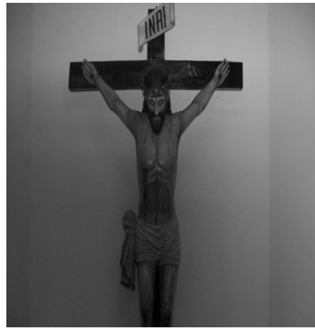
imagen de Cristo Crucificado en ese tamaño que exista en la ciudad.

Según cuenta la historia, el Santo Cristo de la Salud que se venera en la Iglesia de Nuestra Señora de Chiquinquirá, fue traído de España y posiblemente sea la única